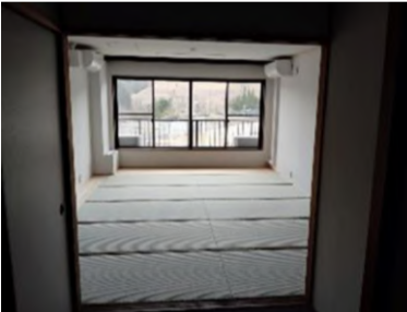
2階会議室イメージ

当面の間、夜間の営業は行いません（宴会は要相談）。メニューは、ランチメニューや各種定食の提供で調整がされており、また、日替わりメニューを予定されています。