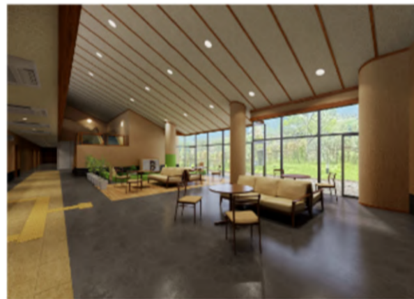
ロビー完成イメージ

の発表の場などの憩いの場を提供します。営業時間は11時から17時の予定です。休業日は火曜日です。