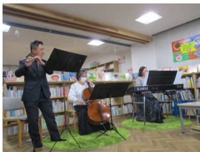
ウバラッシーモさん

三和支所の階段や図書館の壁面は、来館者さんや三和こども園のみなさんに紙皿で作成していただいた「うれしいかお」でいっぱい。また、移転オープンを記念して地元有志の音楽ユニット「ウバラッシーモ」と図書館職員による「音楽で奏でる本の世界」を開催しました。美しい音色に包み込まれ素敵な時間を過ごすことができました。1月28日(日)には、三和支所2階研修室において「みわとしよかんまつり」みかんの木文庫さんといっしょにお祝いしました。『三和はじまりの里』を再開しました。