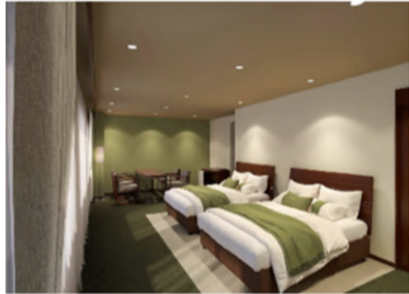
客室305号室完成イメージ