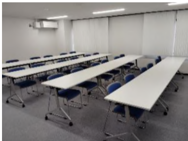
2階大会議室イメージ