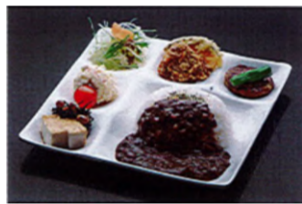
日替わりメニュー例

株式会社ファーストシステムによる「丘の上のレストラン」食卓には「が営業を開始します。レストランのコンセプトは、「三和荘が地域交流の拠点として活性化」する「三和荘が賑わいのある場所とする」とし、食事やカフェ、サークル活動